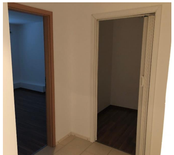
Blick in Schlafzimmer und Reduit