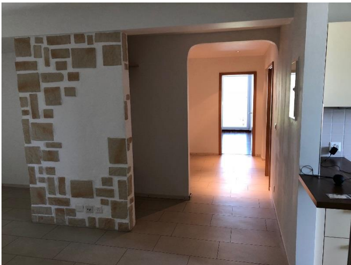
Küche Wohnzimmer und Korridor